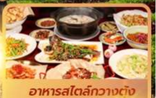
อาหารสไตล์กวางตุ้ง