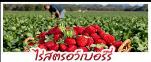
ไร่สตอเบอร์รี่

คฤหาสน์เหวินเจิง - สวนซากุระชิงต้า ไร่สตอเบอร์รี่ - โรงเบียร์ชิงต้า