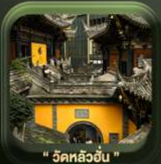
" วัดหลิวอัน "