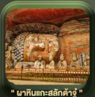
" ผาหินแกะสลักต้าจู้ "