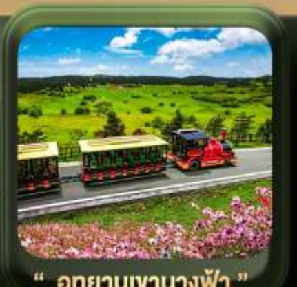
" อุทยานเขานางฟ้า "

T2G-CKG26CZ Special of Chongqing...ลงชื่อ ต้าจู้ อุ้หลง อุทยานหลุมฟ้า เขานางฟ้า 5D 3N (CZ)