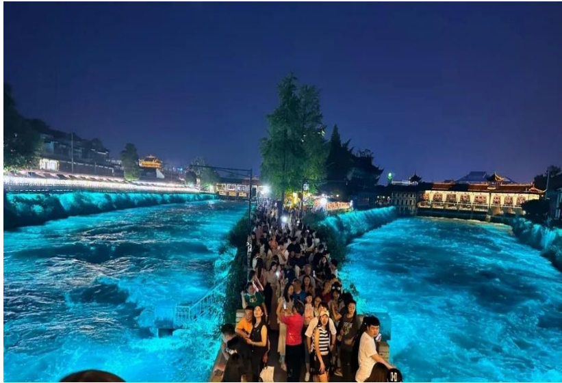
อย่างลึกลับราวกับโลกแห่งเทพนิยาย