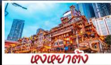
แสงอาคารตั้ง