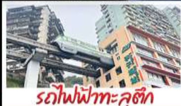
รถไฟฟ้าทะเลลึก