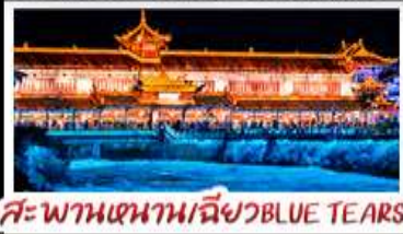
สะพานห่านเขียว BLUE TEARS

สวนบ้านฮาว - อุทยานหลุมฟ้าสะพานสวรรค์ สีดรุณี - หงหยาดัง - รถไฟฟ้าทะเลลึก สะพานห่านเขียว BLUE TEARS พักโรงแรมระดับ 4 ดาว - ไม่ลงร้านช้อปปิ้ง เมนูพิเศษ สุกีหม่าล่า เปิดปิกนิก