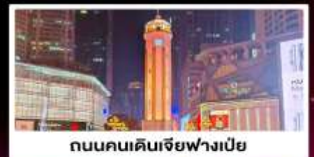
ถนนคนเดินเจี๋ยฟางเป่ย์