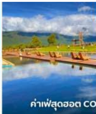
ค่าเฟ่สุดช้อต COFFEE YUN DI AN