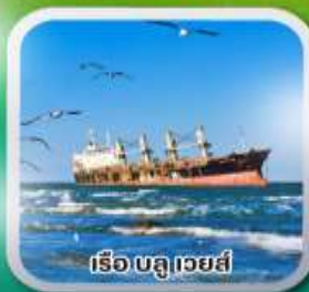
เรือบลูเวสต์