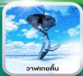
วาฬเพชฌฆาต