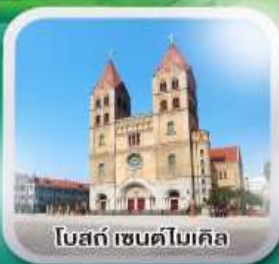
โบสถ์ เซนต์ไมเคิล