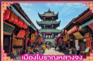
เมืองโบราณหลางจง