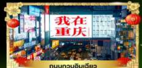
ถนนทวงฉิมเฉียว