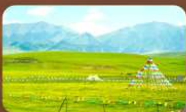
ทุ่งหญ้าออร์คอส