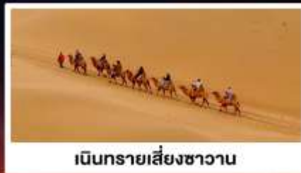
เนินทรายเลี้ยงชาวน