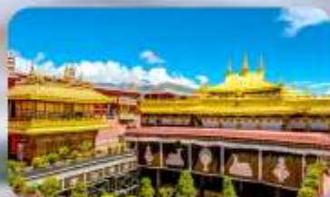
วัดโจกิง