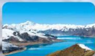
ทะเลสาบยิมครก