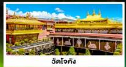
วัดโจกิง