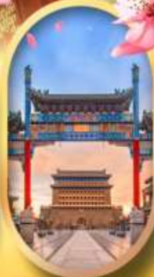
ถนนคนเดินเจียมเหมิน