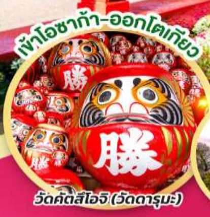
เข้าโซาก้า-ออกโตเกียว