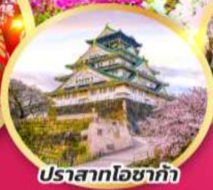
ปราสาทโซาก้า