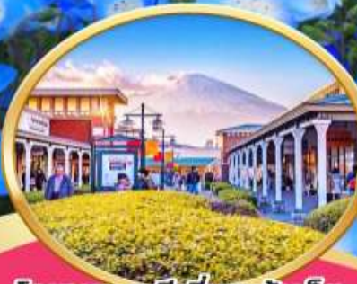
โตเกียว: พรีเมียมเอ้าเล็ต