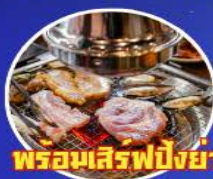
พร้อมเสิร์ฟปิ้งย่างเกาหลี