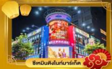
ช้อปปิ้งดิงโถกมาร์เก็ต