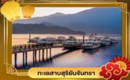
ทะเลสาบสุริยอินจินตรา