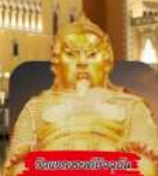
วัดของมาเก๊า