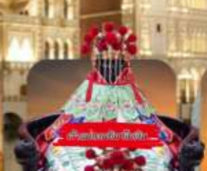
วัดของมาเก๊า