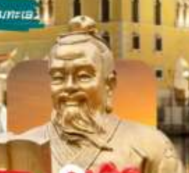
วัดของงกก