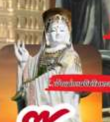
วัดของมาเก๊า