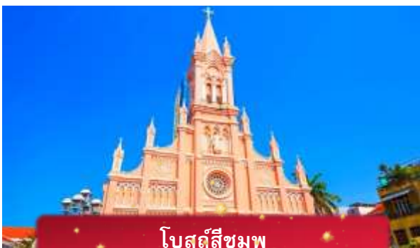
โบสถ์สีชมพู

ค่า บริการอาหารค่ำ ณ ภัตตาคาร พิเศษ ... เมนูบุฟเฟ่ต์ปิ้งย่าง ที่พัก MAGNOLIA HOTEL เทียบเท่าหรือระดับ 4 ดาวท้องถิ่น