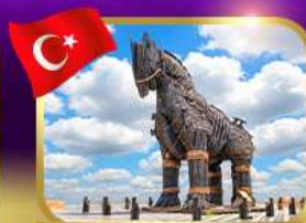
ม้าไม้เมืองทรอย ซานิคคาล