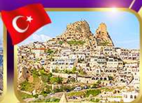
หุบเขาอูซซาร์ คัปปาโดเกีย