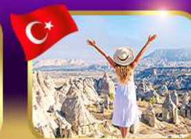
ชมความงาม หุบเขาแห่งรัก