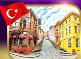
ชมบ้านหลากสีย่านบาลีก