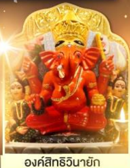
องค์สิทธีวินายิก