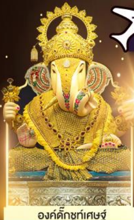
องค์ดีกษุท์เศษฐ์