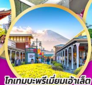
โทเกมบะ-พรีเมียมเฮ้าส์