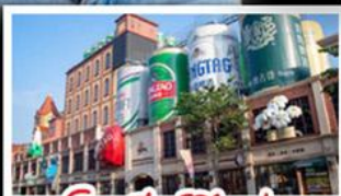
โรงแรมเป่ย์ชิ่งเต่า