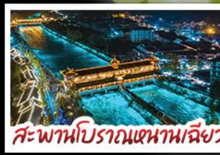
สะพานโบราณแดนพริเฉียว