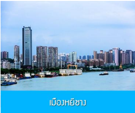
เมืองหยีซัง