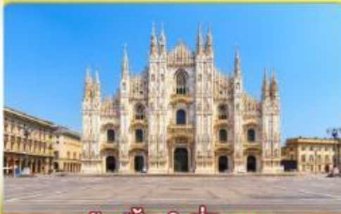
ซอปป์ิงจู่ที่มิลาน