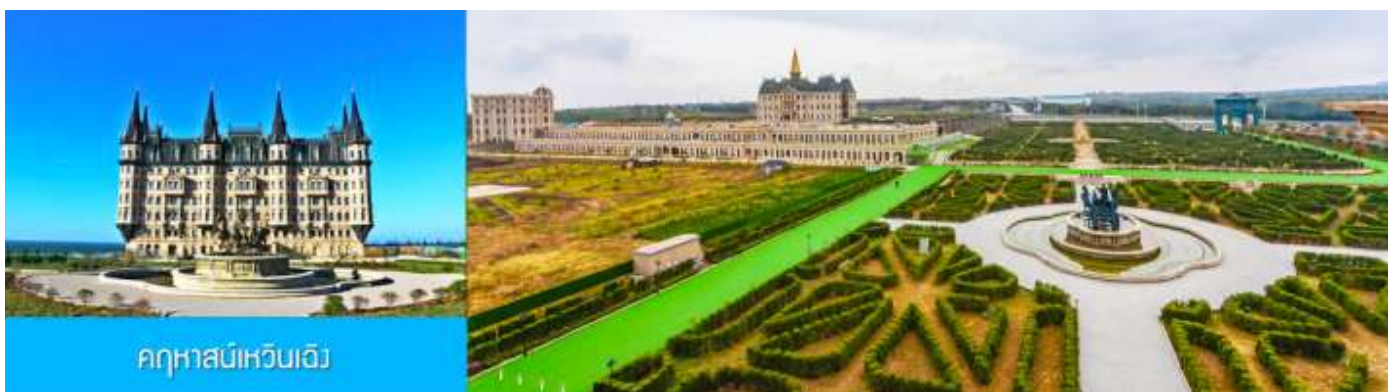
คฤหาสน์เหวินเจิง

นำท่านไปเยือนเมืองท่าสุดโรแมนติคสไตล์ยุโรป ท่าเรือชาวประมง ให้ท่านได้ชมสถาปัตยกรรมสไตล์อเมริกาเหนือ และ ยุโรป ที่ตั้งอยู่ในผืนแผ่นดินจีน ณ เมืองเยียนไถ เก็บบรรยากาศลมทะเล และเก็บรูปกับอาคารหลังคาสี่เสดเป็นฉากหลัง ที่เต็มไปด้วยมนต์เสน่ห์และความทรงจำที่สวยงาม ให้ท่านเก็บภาพความสวย