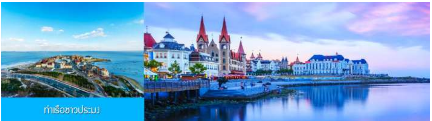
ท่าเรือชาวประมง

08.05 น. ถึงสนามบินเมืองเยียนไถ (เวลาที่ท้องถิ่นเร็วกว่าไทย 1 ชั่วโมง) นำท่านผ่านการตรวจตราเอกสารและรับสัมภาระเรียบร้อย นำท่านเดินทางโดยรถบัสปรับอากาศ เดินทางสู่เมืองเยียนไถ