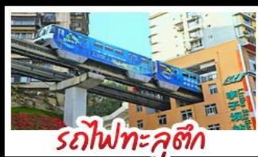
รถไฟทะลุติ๊ก