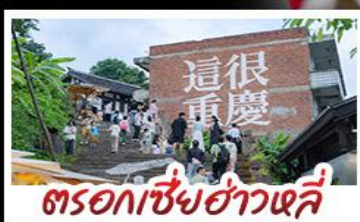
ตรอกเซี่ยงฮ่าวหลี่