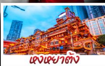
เจงเฉาตั้ง