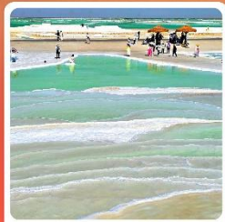
ทะเลสาบเกลือจาเอ้อหนาน

ไฮไลท์! กำมั่วเกาตุ กำพุทธศิลป์โบราณ มรดกโลก UNESCO ภูเขาสายรุ้งจางเย่ ภูเขาหินสีสันแปลกตา หนึ่งในภูมิประเทศที่แปลกที่สุดในโลก