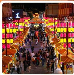
ตลาดกลางคีนซาโจว