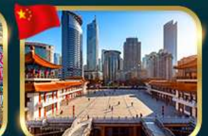
เขื่อนตึกไควซิงโหล