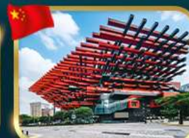
แลนด์มาร์กจิ้ง ตึกตะเกียบ