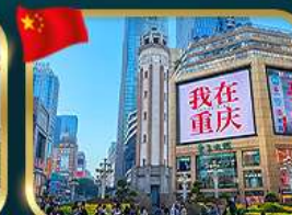
ถนนคนเดินจียฟางป๋าย