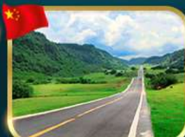
ชมวิวยุทยานฆานางฟ้า