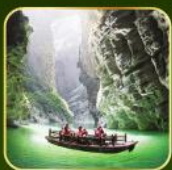
ล่องเรือแม่น้ำไตติงกุฮิว