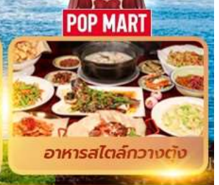
อาหารสตรีทกวางตุ้ง