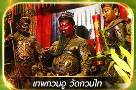
เทพทวนอู วัดกวนไท

ไหว้พระ-จัดเต็มขอพร 9 วัดดัง, นั่งกระเช้ามองปิง สักการะพระใหญ่ไป๋หวลีน ตะลุยดิสนีย์แลนด์ ชมพลุสุดอลังการ !!