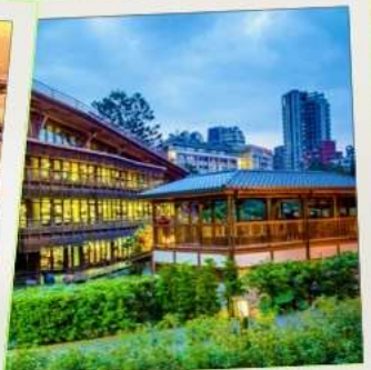
ห้องสมุดเป่ย์โถว