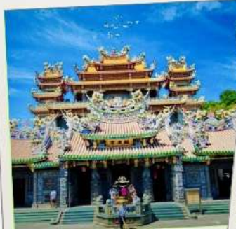
วัดกวนตู่