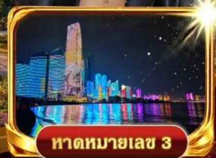
หาดหมายเลข 3