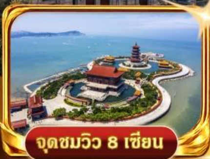
จุดชมวิวก 8 เซียน