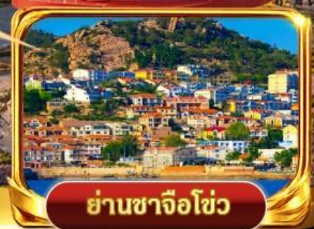
ย่านชาจือไฮ่