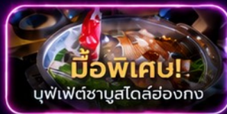
มูพีเค! บุปเฟ่ต์ชาบูสเตอ์ฮ่องกง

UpperHills จุดถ่ายรูปสุดชิบของวัยรุ่นเซินเจิ้น - OCT Loft ย่าน Creative Park - OCT Harbour Happy Coast - Shenzhen Bay Culture Plaza - Cyberpunk พิพิธภัณฑ์ศิลปะร่วมสมัยเซินเจิ้น (MOCAPE) - Joy City Center (One Avenue) - Shenzhen Civic Center - shigu garden - วัดเจ้าแม่กวนอิม - วัดแชกงหมิว