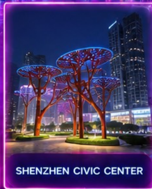
SHENZHEN CIVIC CENTER