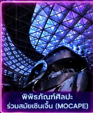
พิพิธภัณฑ์ศิลปะร่วมสมัยเซินเจิ้น (MOCAPE)