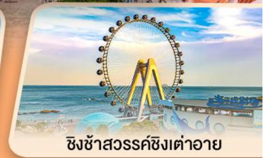
ชิงช้าสวรรค์ซิงต้าอาย