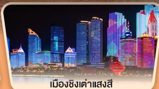
เมืองซิงต้าแสงสี