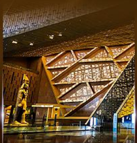
พิพิธภัณฑ์ไทรนิตี้อียิปต์ (GEM)