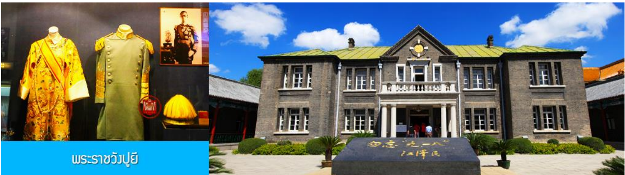
พระราชวังปู้ยี้

รับประทานอาหารเช้า ณ ห้องอาหารของโรงแรม (7)