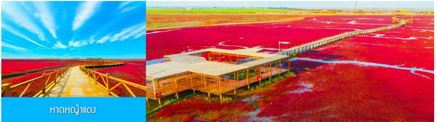
หาดหญ้าแดง

หลังอาหารนำท่านเดินทางสู่ เมืองผานจิน 盘锦 (ระยะทาง 170 กม. ใช้เวลาเดินทางราว 2 ชั่วโมงเศษ)