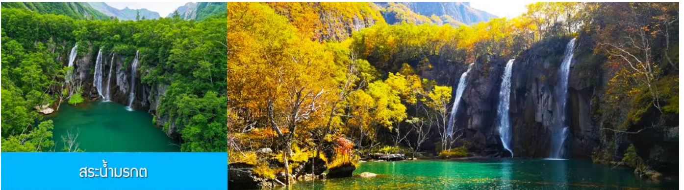
สระน้ำมรกต

หลังอาหารนำท่านเที่ยวชม ยอดเขาฉางไป่ซาน 长白山 (จีน/ลงเนินด้านทิศเหนือ) ชมความงามที่เร้นลับของ ทะเลสาบเทียนฉือ 天池 ที่เชื่อกันว่าเป็นแหล่งน้ำศักดิ์สิทธิ์ที่อยู่ใกล้สวรรค์จนเป็นที่มาของคำว่าเทียนฉือที่แปลว่าทะเลสาบบนสวรรค์ ชม น้ำตกเขาฉางไป่ซาน 长白山瀑布 เป็นน้ำตกที่ไหลลงมาจากหน้าผาขนาดใหญ่ที่มีความสูง 68 เมตร น้ำตกแห่งนี้เป็นจุดน้ำไหลออกของทะเลสาบเทียนฉือ และเป็นต้นกำเนิดของแม่น้ำซงฮัวเจียง....ชม สระน้ำมรกต 绿渊潭 สระน้ำสีเขียวมรกตที่มีน้ำตกน้อยสองสายที่คอยเติมน้ำเข้าไปในสระ เป็น