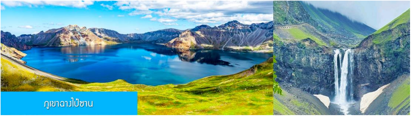
ภูเขาฉางไป่ซาน

หลังอาหารนำท่านเที่ยวชม ยอดเขาฉางไป่ซาน 长白山 (จีน/ลงเนินด้านทิศเหนือ) ชมความงามที่เร้นลับของ ทะเลสาบเทียนฉือ 天池 ที่เชื่อกันว่าเป็นแหล่งน้ำศักดิ์สิทธิ์ที่อยู่ใกล้สวรรค์จนเป็นที่มาของคำว่าเทียนฉือที่แปลว่าทะเลสาบบนสวรรค์ ชม น้ำตกเขาฉางไป่ซาน 长白山瀑布 เป็นน้ำตกที่ไหลลงมาจากหน้าผาขนาดใหญ่ที่มีความสูง 68 เมตร น้ำตกแห่งนี้เป็นจุดน้ำไหลออกของทะเลสาบเทียนฉือ และเป็นต้นกำเนิดของแม่น้ำซงฮัวเจียง....ชม สระน้ำมรกต 绿渊潭 สระน้ำสีเขียวมรกตที่มีน้ำตกน้อยสองสายที่คอยเติมน้ำเข้าไปในสระ เป็น