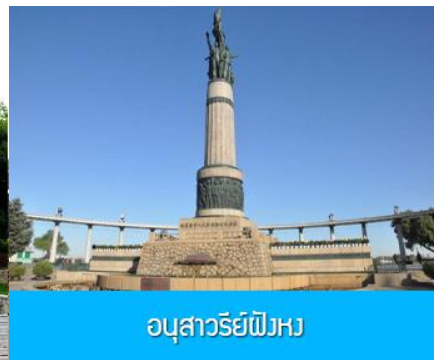
อนุสาวรีย์พิงหวง