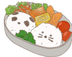
● อาหารสำหรับเด็ก ( 2-11 ปี ) *วัตถุดิบขึ้นอยู่กับทางร้าน