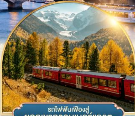
รถไฟฟันเฟืองสู่ ยอดเขากรอนเนอร์เกรต