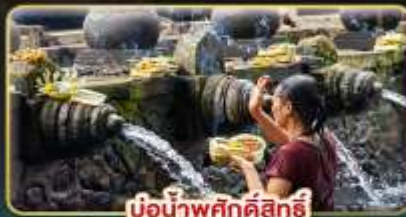
บ่อน้ำพุศักดิ์สิทธิ์