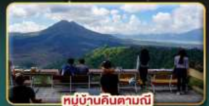
หมู่บ้านคินตามณี