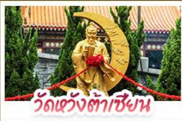
วัดเข่งต้าเซียน