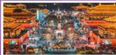
ถนนวัฒนธรรมราชวงศ์ถัง