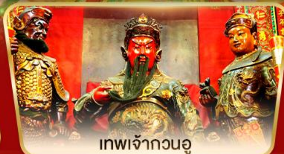
เทพเจ้ากวนอู