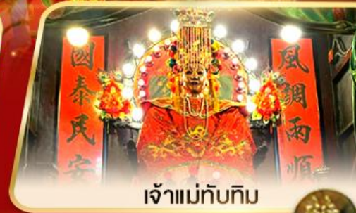
เจ้าแม่ทับทิม