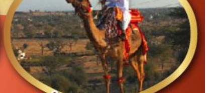
ฟรี ژی้อู เมืองมันทอวา ราคาเริ่มต้น