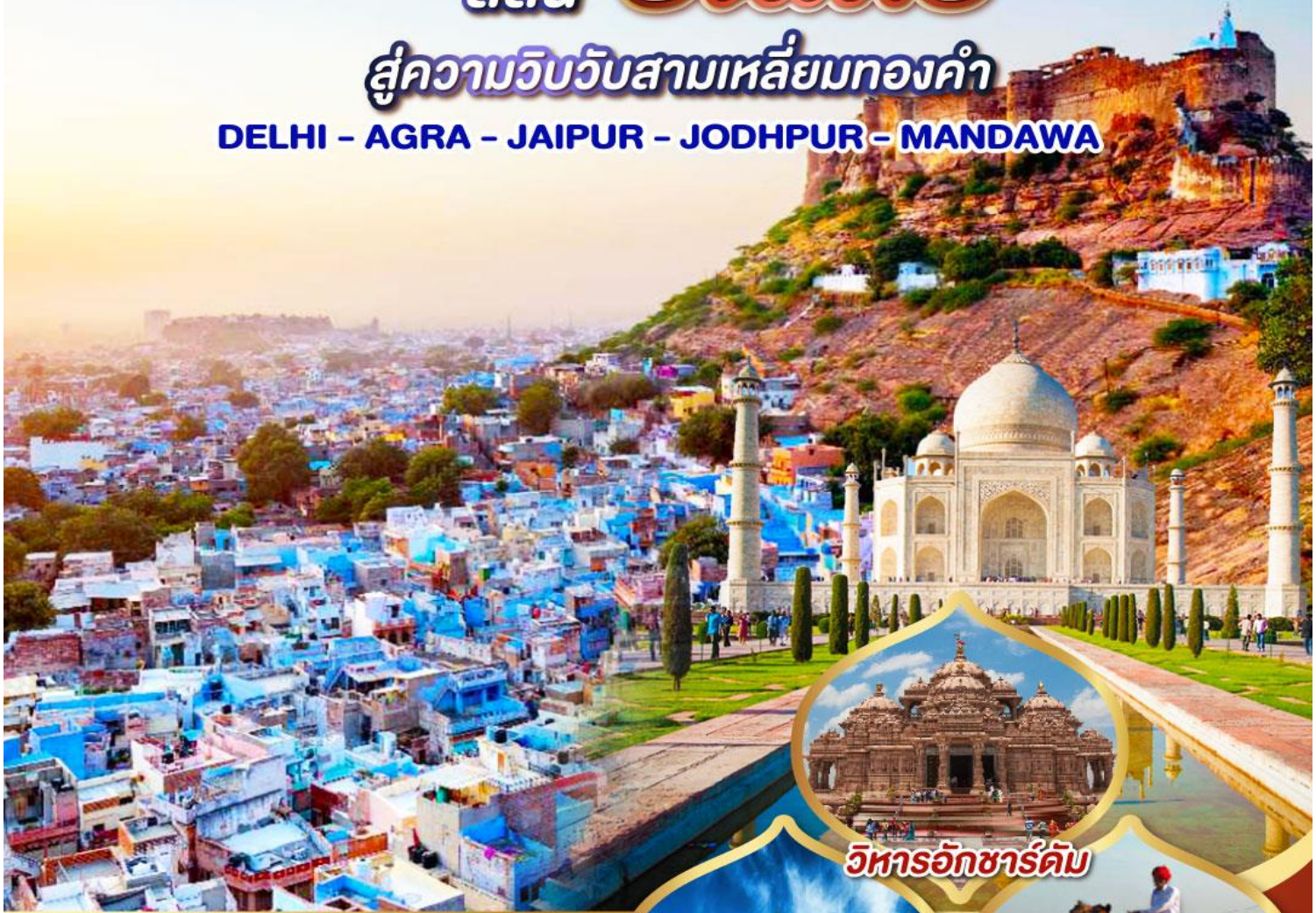
วิหารอักซาร์ดีม

DELHI - AGRA - JAIPUR - JODHPUR - MANDAWA