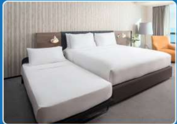
👤👤+👤 TRIPLE (TRP)

**รูปภาพห้องพักเป็นเพียงภาพสื่อถึงประเภทของเตียงเท่านั้น ไม่ใช่ภาพห้องพักจริงสำหรับการเข้าพัก**