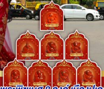
พระพิฆเนศ 8 องค์ เมืองปูเณ